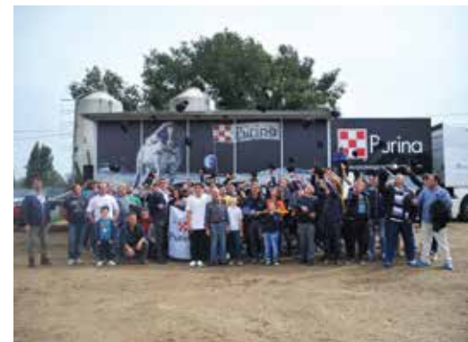
In alto: foto di gruppo per i partecipanti alla tappa casertana del Road Show