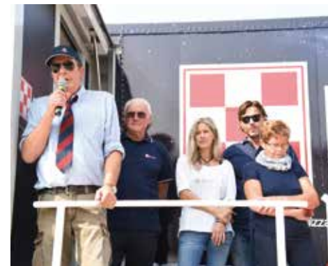
In alto: un momento della premiazione