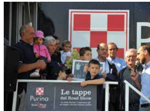
In alto: La premiazione degli allevatori cuneesi