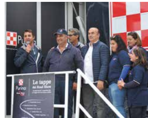
In alto: un momento della premiazione