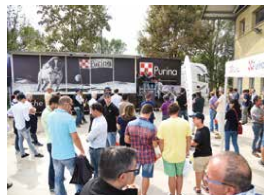
In alto: il truck in azienda