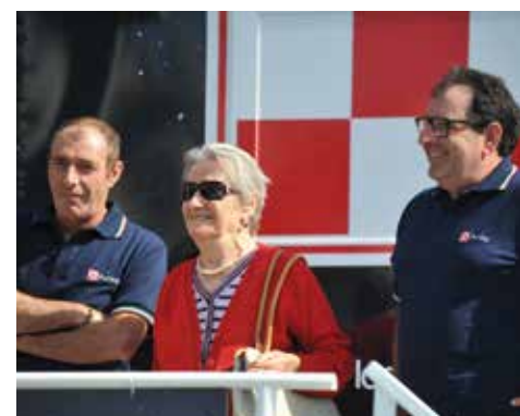
In alto: un momento della premiazione